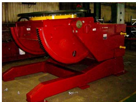
Posicionador 15 Tn