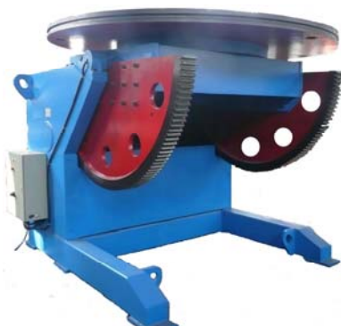
Posicionador 25 Tn