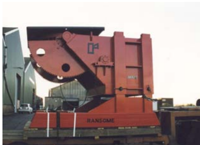
Posicionador 40 Tn