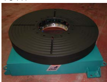
Posicionador Horizontal 10Tn