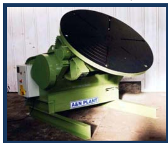
Posicionador 7,5 Tn